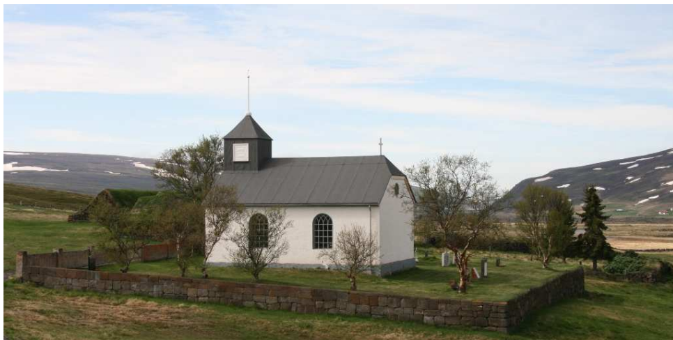
Þverárkirkja í júní 2013.