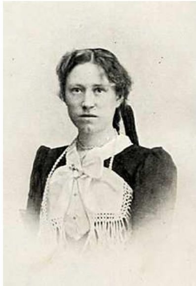
HULDA hét réttu nafni Unnur Benediktsdóttir Bjarklind. Hún var fædd 6. ágúst árið 1881 á Auðnum í Laxárdal. Fyrsta bók hennar, Kvæði , kom út árið 1909, en eftir það sendi hún frá sér bæði kvæðasöfn og sögur. Eitt af þekktustu kvæðum Huldu er Hver á sér fegra föðurland .

Aldrei gleymi ég þeim dýrðarljóma, sem mér fannst vera yfir þessari guðspjónustu. Allt var ljósum prýtt og óvenju mikið sungið. Presturinn var ungur og ljúfmannlegur og hafði fagra rödd. Ræðan var örstutt, en söngurinn margbreyttari en venja var til og allt með einhverjum unaðslegum hátíðablæ í fallegu kirkjunni hans afa á Þverá. . . . .