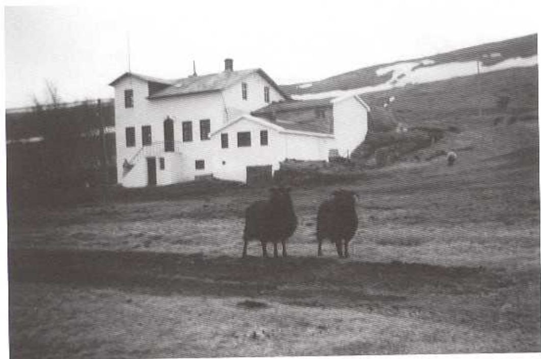
Holt í Fellum, fæðingarstaður Helga.