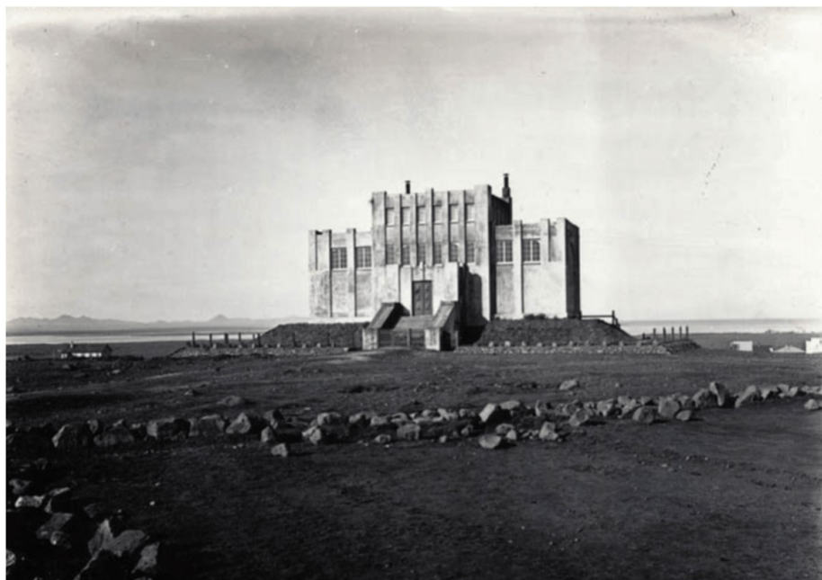
Listasafnið var vígt á Jónsmessu 1923. Þessi mynd er tekin fyrir.